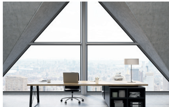
Ventanas y cerramientos / Windows and enclosures*