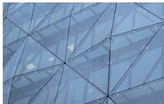
Fachadas, 2ª piel / Façades, 2nd skins*